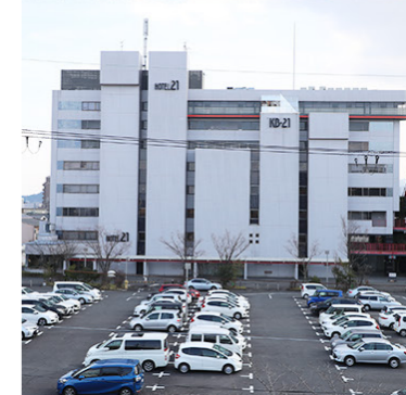
駐車場とホテル前