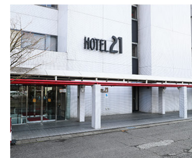
ホテル21エントランス