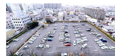
ホテルから眺める駐車場